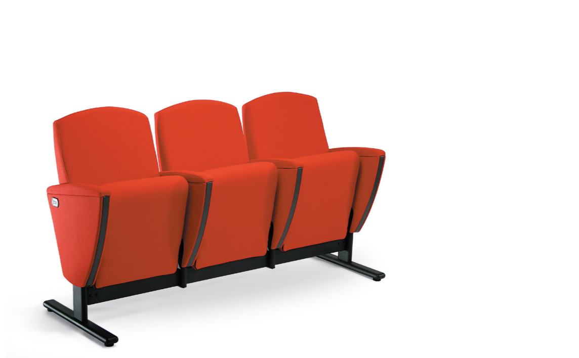
AURA WAITING CHAIR